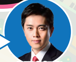
大阪府知事 吉村 洋文

特別区は住民の声が届きやすくなり、今と同じ財源だとしてもそれをいかに有効に使っていくかという切磋琢磨が区間に生じるので、住民サービスは拡充するというのを改めて強くイメージできた。