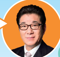
大阪市長 松井 一郎

今日この場に反対派の議員に出席して、彼らが言っている都構想の経済効果への批判を議論してもらいたかったが、欠席するのは残念。