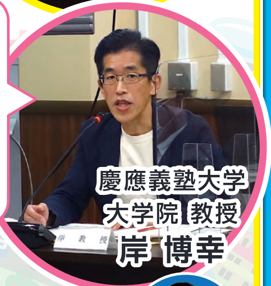
慶應義塾大学 大学院教授 岸 博幸

今後コロナによって人々の意識や生活が大きく変わるため、コロナ後を視野に入れた柔軟に政策を打ち出せる都市機構が今後重要になる。だからこそ住民投票もしっかりやる必要がある。