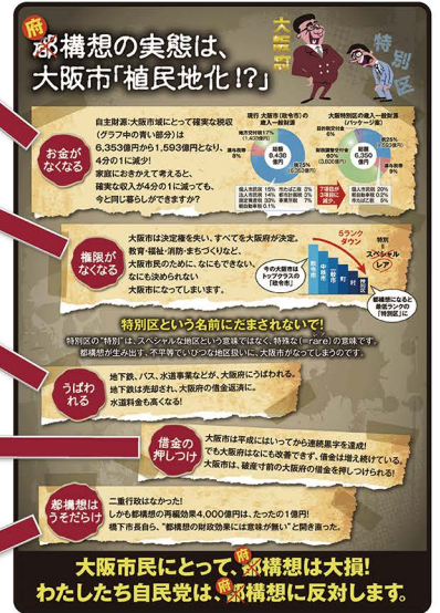
自由民主党大阪市議員団市政報告より抜粋