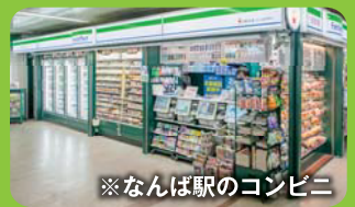
※なんば駅のコンビニ